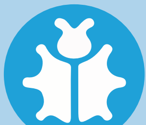
Haittaohjelmien vaikutus liiketoimintaan